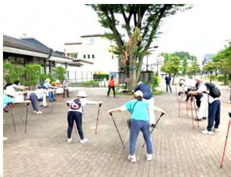
▲ノルディックポールを使った準備体操も念入りに