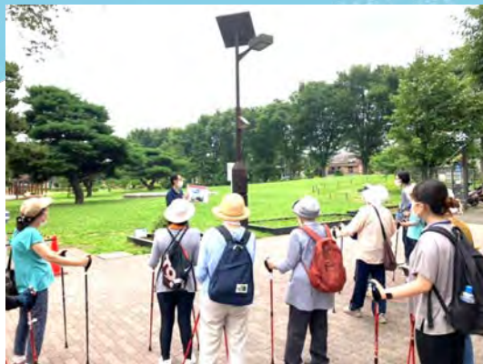
▲太陽光パネルが設置されている街灯

参加者からは積極的な質問が飛び交い、防災意識の高さがうかがわれました。同時にノルディックウォーキングも好評であり、実りの多いイベントとなりました。「食」のキーワードについては、備蓄食品の提供にとどまりましたが、次の機会があれば備蓄食品の試食会やアレンジレシピなどもご紹介できるといいなあ、と思いを巡らせています！（宮地）