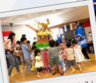
かわいかった子どもみこし