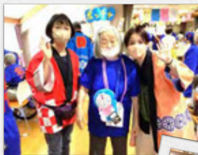
くじ引きで「2等賞のドラえもんポシエット」をGET!

参加してくださった方から「チラシを見て楽しみで今日は来ました。いろいろな方と触れ合えることができるととても良いと思います」「子どもがこの夏のお祭りの中で一番楽しかった!!!」と喜んでおりました」と話してくださいました。ご利用者も地域の小さな子どもたちのかわいい姿に目を細め、たくさんの笑顔を見せてくださいました。(本橋)