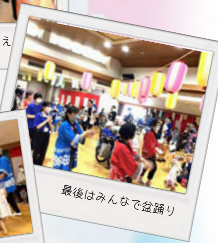
最後はみんなで盆踊り