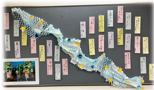
火曜日の書道の時間に短冊を書きました