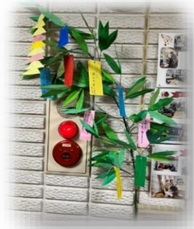
手作りの笹の葉です！

7月7日（金）みずきっこ親子さんと一緒に七夕祭りを開催しました。今回は、大野田福祉の会の皆さんにお越しいただき、七夕にちなんだ紙芝居をご披露していただきました。織姫や彦星が紙芝居の中から飛び出るなど工夫あり、大人が見ても楽しい紙芝居でした。みずきっこの子供は夢中になって見ていました。紙芝居の後は、子供達の紹介をしていただき可愛らしい姿に癒されました。