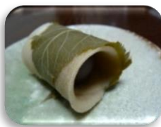
ひな祭り御膳とおやつは手作りの桜餅

午後は、音楽プログラムで、みずきっことオンライン中継をしました。可愛い参加者の中に、はかま姿のお子さんがいて、センターに一足早い春が訪れたようでした。